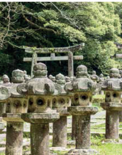
▲ Kamienne latarnie na terenie świątyni Tōkō-ji