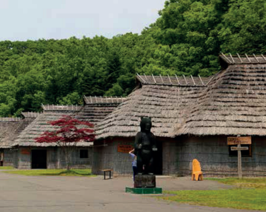
▲ Wioska Ajnów na Hokkaido