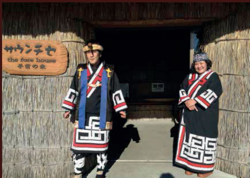
▲ Rdzenni mieszkańcy wioski Ajnów