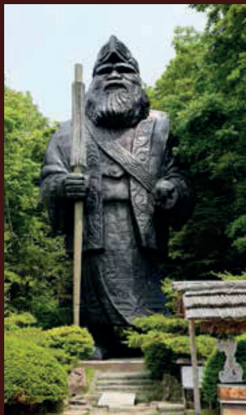
▲ Posąg jednego z ajnuskich bóstw